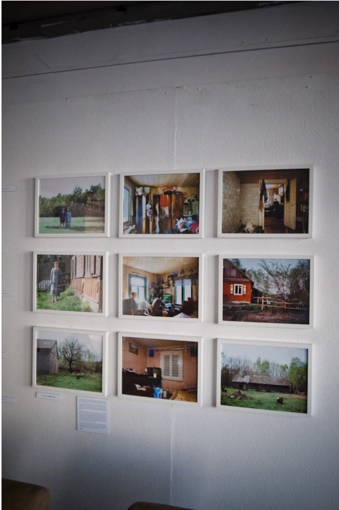
Wystawa w przededniu otwarcia, 2.06.2011 r.