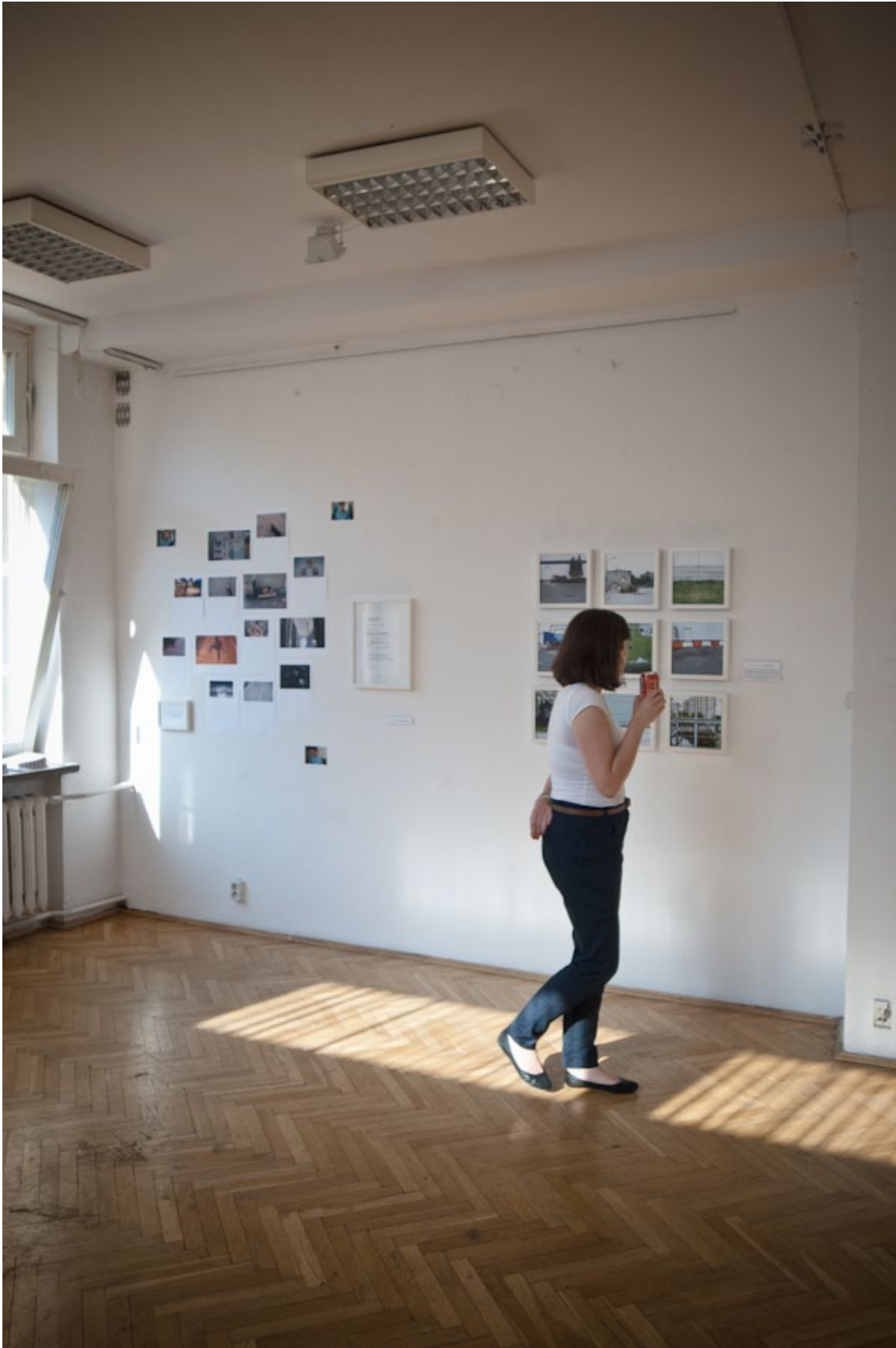
Wystawa w przededniu otwarcia, 2.06.2011 r.